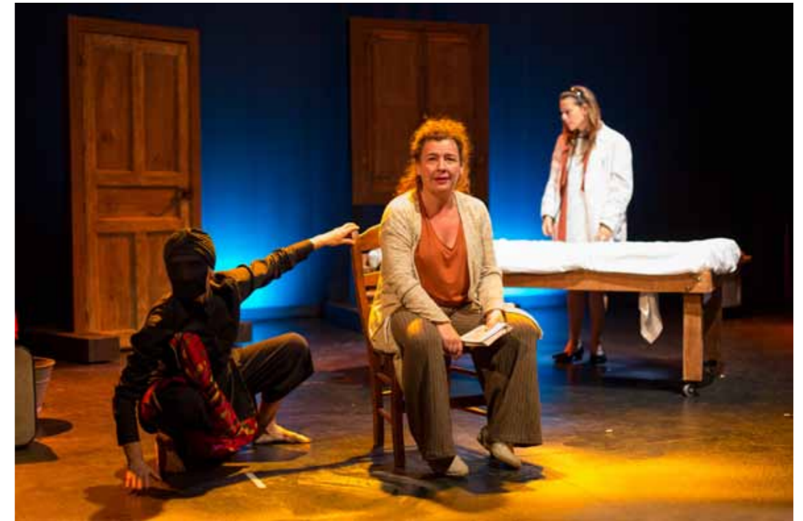
Cuaderno en blanco